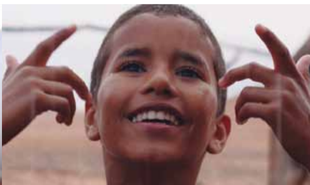
PALABRAS DE CAMELO

X 18 / 19,30 h. Casa de Cultura de Cangas de Onís