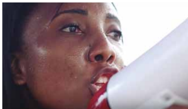
VIDAS EN TRÁNSITO

Vidas en tránsito es un documental realizado por Minority Rights Group International (MRG) y el Movimiento de Mujeres Dominico Haitianas (MUDHA) que visibiliza la dura realidad, la permanente situación de racismo y la desprotección legal de la población haitiano descendiente en República Dominicana que actualmente se enfrenta a situaciones de apatridia en su país de nacimiento.